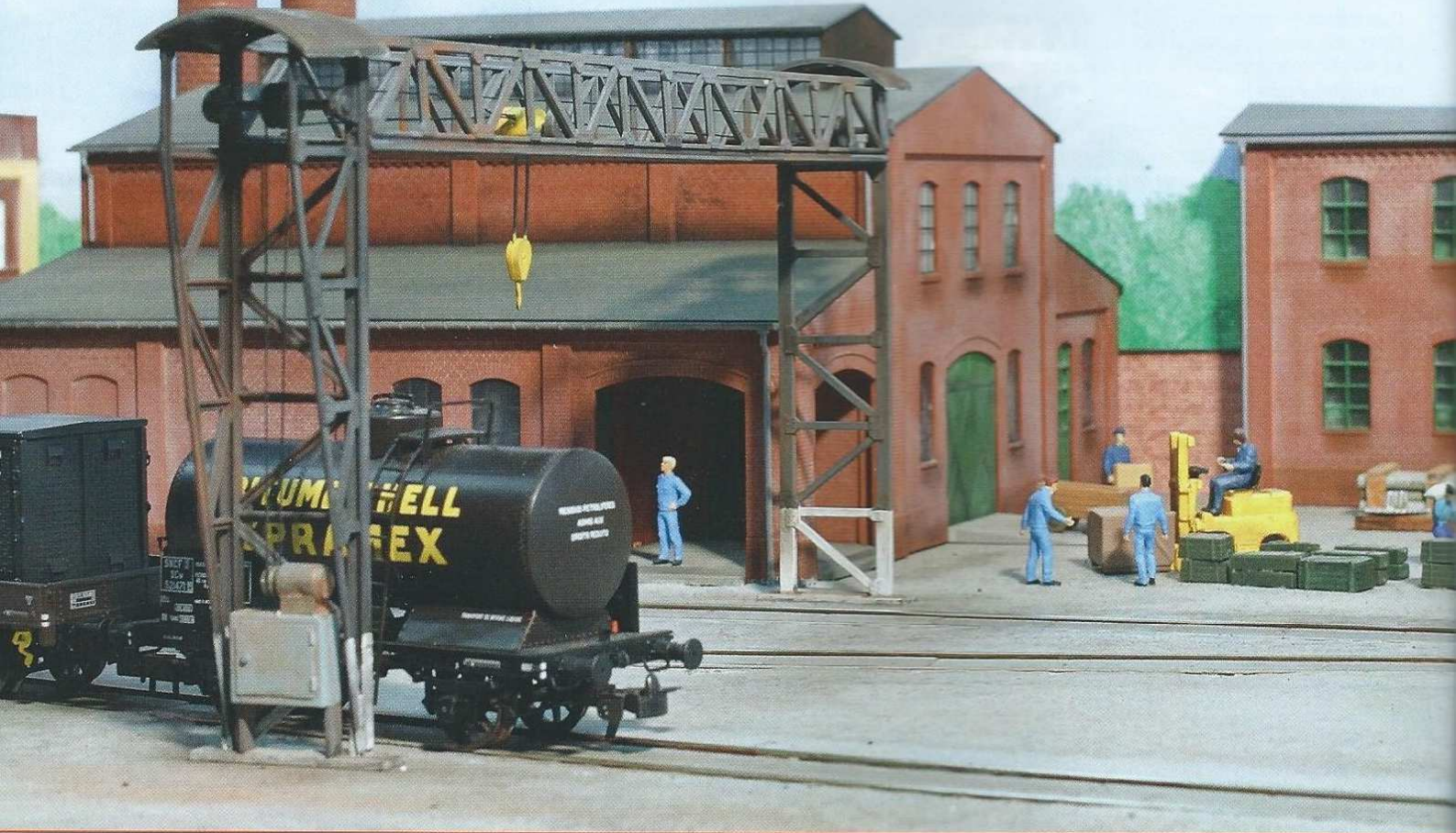
Sur le réseau en H0 du club Rail 86, ce locotracteur quitte l'enceinte de la manufacture d'armes et se dirige vers la gare de Châtellerault.

reproduction fidèle, mais plutôt une évocation, le site réel étant trop vaste pour être transposé tel quel à l'échelle H0. Les quatre modules, dont un qui reste encore à terminer, ont nécessité un an et demi de travail. L'ensemble est digitalisé.